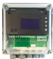
Automatikk EBC 24 EBC24EU01 Styring til innendørs montasje EBC24EU02 Styring til utendørs montasje