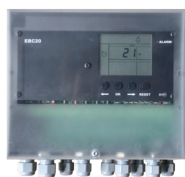
Automatik EBC 20 EBC20EU01 Styrning avsedd för inomhus montage EBC20EU02 Styrning avsedd för utomhus montage